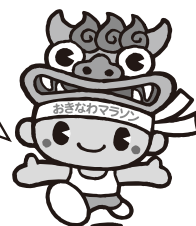
おきなわマラソンの キャラクター「シータン」